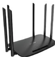
商业WiFi 支持主流品牌厂商对接