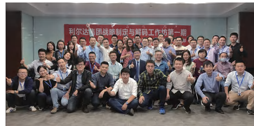
△2021年度“顶层战略梳理”工作坊

2020年对利尔达人来说是有挑战性的一年，但同时也是收获的一年。相信有了对集团战略管理的学习和沉淀，利尔达人一定可以向共同的目标更进一步！