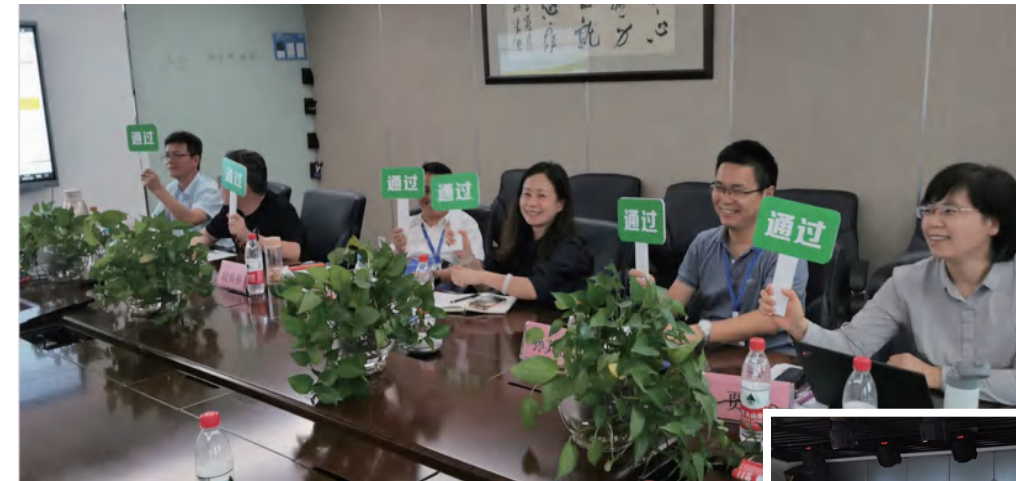
△“集团战略管理委员会”现场评审

今年7月，集团战略管理部召开“2020年集团半年度战略调整工作会”，由各事业部及职能部门主要负责人述职报告，“集团战略管理委员会”现场评审，对年初制定的战略目标和任务进行审核、修正、更新、复盘。